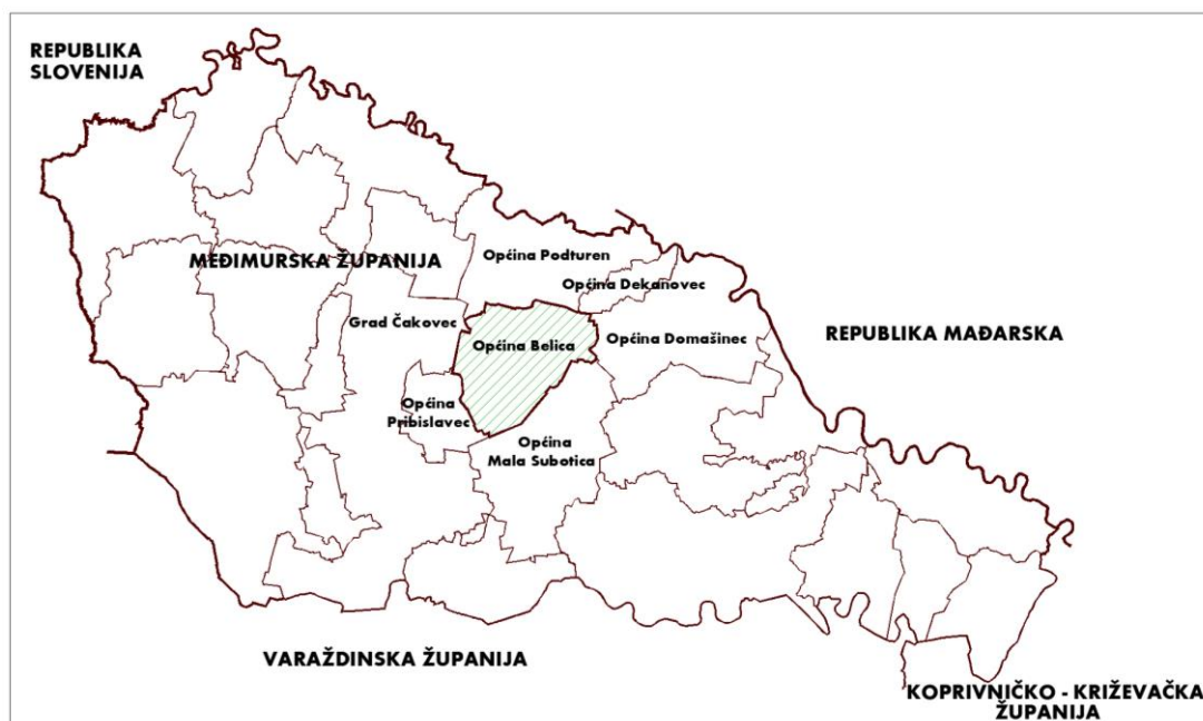
Prikaz 1 Pozicija Općine unutar Međimurske županije

Općina Belica graniči južno s Općinom Mala Subotica, istočno s Općinom Domašinec, sjeverno s Općinom Dekanovec i Općinom Podturen, te zapadno s Općinom Pribislavec i Gradom Čakovcem.